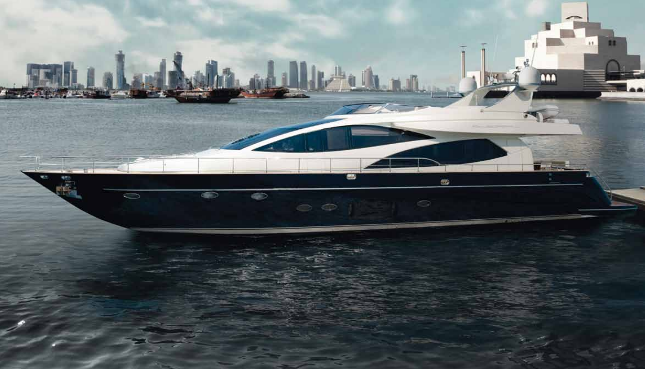
85' OPERA SUPER